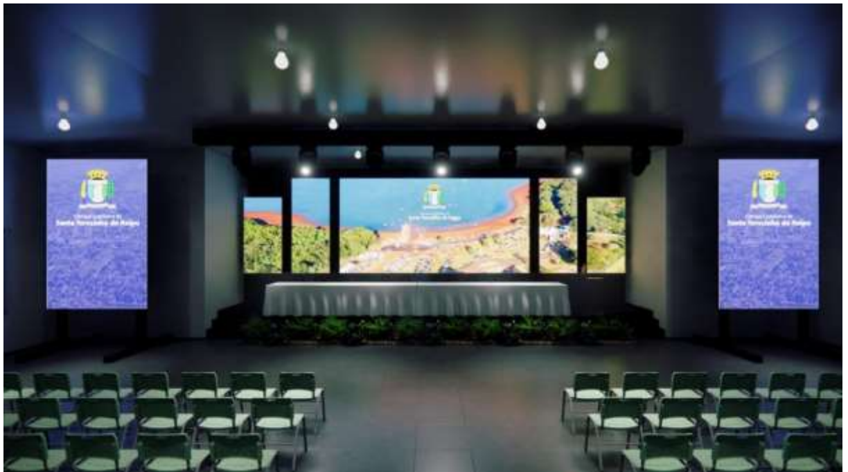
IMAGEM 3 E 4 – VISTA FRONTAL ENTRADA RECEPÇÃO E PAINEL DE LED